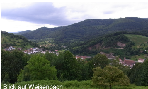
Blick auf Weisenbach

Sie wandern weiter leicht bergab wieder aus dem Wald heraus, oberhalb befindet sich der Schafstall. Leicht abwärts führt nun der Weg durch Streuobstwiesen mit einem herrlichen Blick auf Weisenbach zurück zum NaturFreunde Haus.