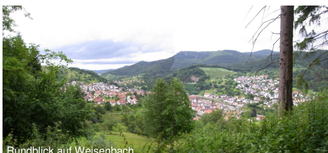
Rundblick auf Weisenbach